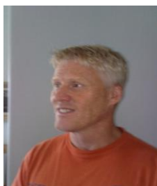
Herr- och pojkdelen